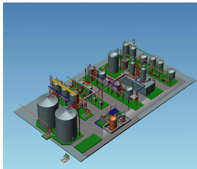
MPDS4 può esportare facilmente impianti o stabilimenti completi

MPDS4 REVIEW offre una flessibilità eccezionale nel suo concetto di licenza, permettendo all'utente di utilizzare una licenza per usi differenti come il rilascio a tempo determinato a colleghi, ad un team di progettisti esterni o a clienti. E' sufficiente trasferire la licenza del server di licenza per il periodo richiesto, senza incorrere in costi aggiuntivi. Alla fine del periodo selezionato, la licenza viene trasferita in modo automatico al vostro server di licenze.